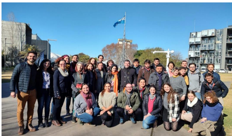
Foto: Estudiantes y coordinación académica en el cierre presencial, UNSAM.